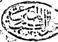
نودج لصفحة العنوان من النسخة (ج)